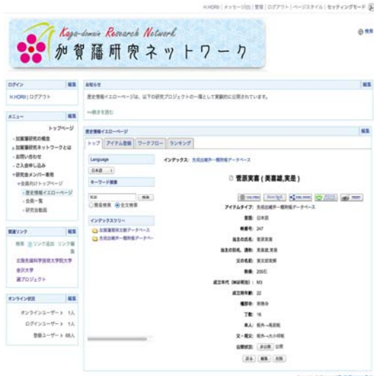
図2：由緒帳データベース外観

(1) 主な利用者が学術研究者あるいは非学術研究者（一般市民）を明らかにする必要がある。学術研究者向けには、利用者自ら検索結果情報の正確性・妥当性を検証できるように、出典や根拠を参照できる環境の実現が求められる。また、一般市民向けには、抽象的なキーワードによる検索や、現代語による解説などを整備する必要がある。