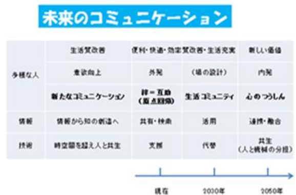
図 3 未来のコミュニケーション

こうした人も多様化して、身体的障害を持つ人から、ゲームで心的障害を受けた人に及ぶ。連携と融合で生まれた新しい支援技術も多様化、支援要請と支援提供の組み合わせも重要となっている。この解を個人で見つけることも、創り出すことも容易でない。環境を同じくする人の生活改善するコミュニティとそれを支える技術が必要である。改善された生活の質により、新しい価値を求め、広く人と人の心の繋がりが模索される。生活の質改善の共同作業を、NWを通して行うのである。