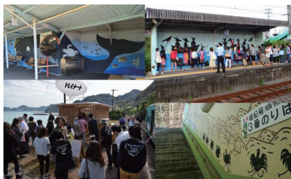
図 2 トレイナートの駅舎アート実施の様子

当日までの準備や当日の実施状況は、NHK、朝日放送、TV 和歌山、フジ TV 等の放送や、新聞全国版各紙や地元紙等にも多数報道された。また当地でロケ中の映画「たまご」も連動企画された。図 2 に各駅舎アートの代表例を示し、図 3 にイベント代表例を示す。