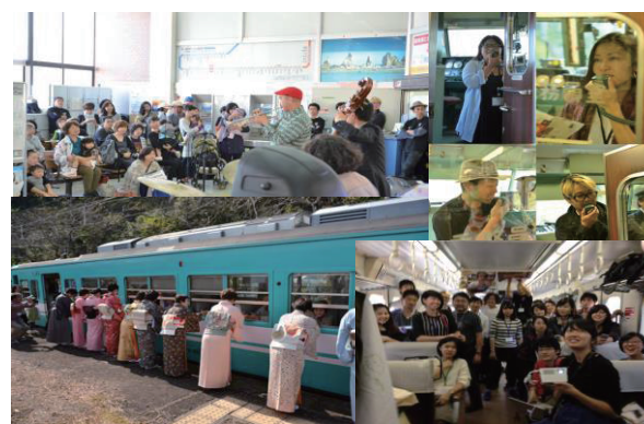
図 3 トレイナートのイベント実施の様子

現地調査や関係者のインタビューそして報告書を基に、本アート・プロジェクトの担い手に関する成果を表 2 に整理した。