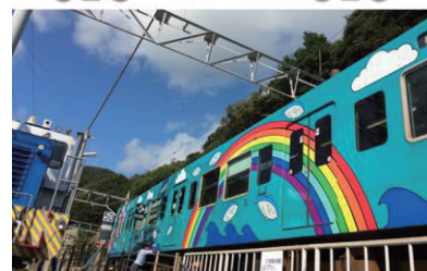
図 1 デザイン列車のデザインと実物

当日までの準備や当日の実施状況は、NHK、朝日放送、TV 和歌山、フジ TV 等の放送や、新聞全国版各紙や地元紙等にも多数報道された。また当地でロケ中の映画「たまご」も連動企画された。図 2 に各駅舎アートの代表例を示し、図 3 にイベント代表例を示す。