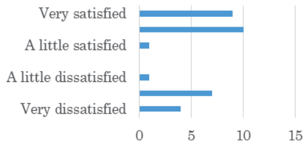
Fig. 3 Satisfaction level in income

本研究は JST の SICORP、Japan-ASEAN Science, Technology and Innovation Platform の資金と、マラヤ大学の研究費のもとに行われている。