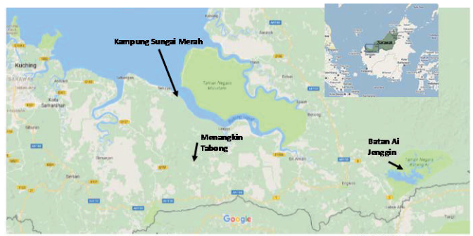
Fig. 1 Location of the studied villages

実際に調査を行った村落は、住民の協力度や電力使用への希望状況、更には実際に訪問可能な立地であるかを考慮に入れて選択した。また、電化計画についても、電力線の延長、太陽光システム導入といった異なる計画を持つ Menangkin、Tabong、Jenggin、Kampung Sungai Merah (Fig. 1) の 4 つの村落を選んでインタビュー調査を行った。調査はこれまでに年齢 20 歳から 71 歳までの 33 人の住民に対して、2016 年 4 月から 2017 年 2 月にかけて行われた。インタビュー調査には、マラヤ大学およびスウィンバーン大学の協力のものと、現地語を用いて行った。