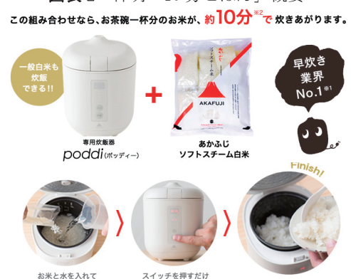
図表 2 神明「10 分ごはん」概要 [2]

T.M.L 社の代表取締役社長である山川裕夫氏は、1993 年に早稲田大学で研究を開始した [3] 。研究開始当初のテーマは、地域活性化、特に農畜水産業活性化であった。山川氏は、日本の多様な食材に対して新技術による加工を行い、新商品を作っていくことが、将来の日本の農畜水産業の活性化につながると考えた。そこで、食品加工技術の研究に注力し、2003 年に T.M.L 社を立ち上げた [4] 。その研究成果として開発されたのが、ソフトスチーム（以下、SS）技術である。SS 技術を利用した代表的な商品に、株式会社神明の「10 分ごはん」がある。「10 分ごはん」は、10 分で炊ける「あかふじソフトスチーム白米」と、SS 米用小型炊飯器「poddi（ポッディー）」とのセットである（図表 2）。