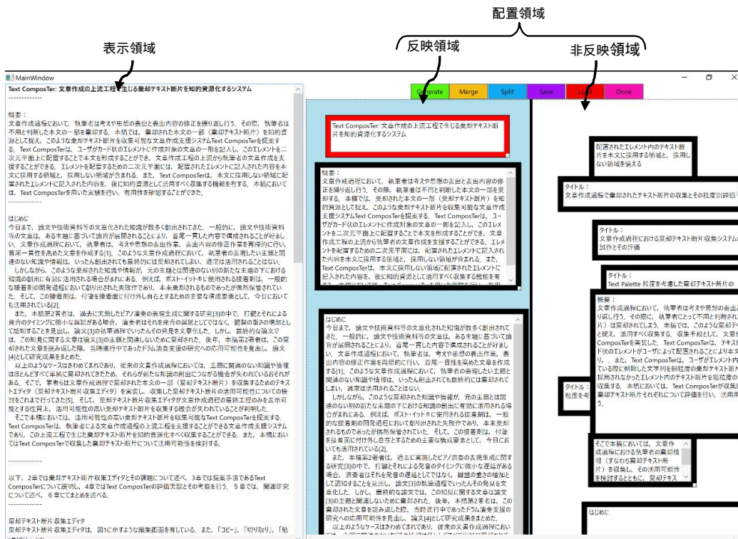
図1 TextComposTer のユーザインタフェース

年度下期から 29 年度上期にかけて、研究代表者の研究室における論文作成などの現実的な文書作成状況で本文書作成環境を使用し、その有効性を検証する。平成 29 年度下期は、研究を総括する。