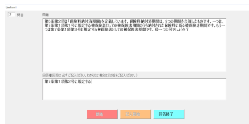
図5 被験者実験のPC画面

国民年金法の条項を分析し構造的書換えの枠組みを得た。これは条項の要件効果構造を理解しやすくすること、及び機械化しやすくすることを考慮したものである(図2、図3)。枠組みは、かっこ書き挿入文の注への置き換え、要件効果構造の主題や要件を考慮した改行、複雑な名詞句の英字記号による置き換え、並列名詞句の要素ごとへの余白文字の挿入、