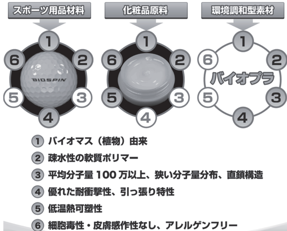
図3 トチュウエラストマーの商品例