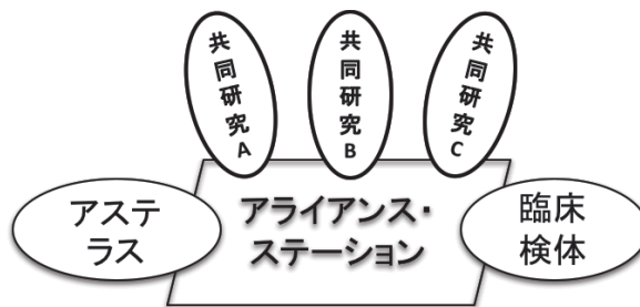
図2:アライアンス・ステーション概念図

を踏まえて、より発展させた共同研究のスキーム案であるアライアンス・ステーション構想を作成した。具体的には、研究テーマを免疫分野に限らず様々な疾患にテーマを広げられるようにすること、臨床ニーズの把握や臨床サンプルの利用等、臨床科との連携をより進めることとし、MICにアライアンス・ステーションを置き、アライアンス・ステーション協働するための基盤として様々な個別共同研究を進めることが盛り込まれていた(図2)。