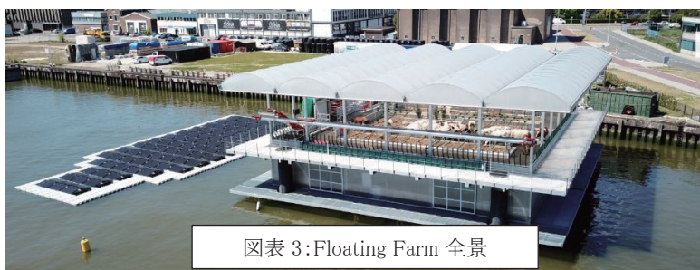
図表 3: Floating Farm 全景

Floating Farm は三層構造になっている。1 層目が建物全体を水上に浮かせるための浮揚部、2 層目が搾乳エリアと牛乳加工（殺菌、ヨーグルト製造）設備およびエネルギーや水等のインフラ設備、3 層目が 40 頭を育成できる牛舎、となっている。これに海洋浮遊型の太陽光発電パネルが併設され、Floating Farm の使用エネルギーは全て賄えるよう設計されている。