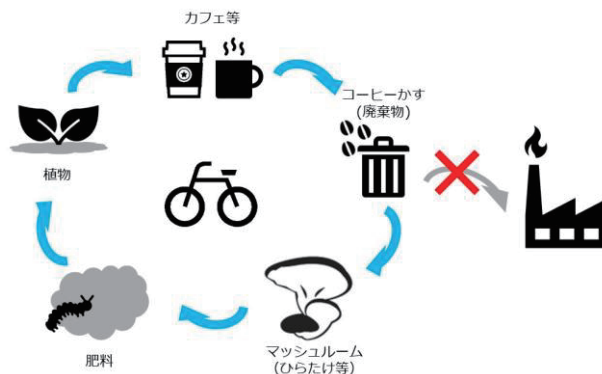
図表 2: HaagseZwam 社の CE サイクル概念図

ハーグ市では、毎年 6 千トンものコーヒー豆が消費され、「コーヒーかす」も同程度廃棄されている。カフェ等はこのコーヒーかすを、通常の約 5-10 倍にもなる廃棄料を支払い、同社に回収 11 してもらい、四半期毎にその廃棄総量と CO2 排出削減量に関するレポートを同社から受け取る。つまりカフェ等が高額な廃棄料を支払う対価は、環境配慮型企業としての PR 効果の側面がある。同社はこのサービスを開始して 1 年間で約 7 トンのコーヒーかすを活用した。これはハーグ市内のコーヒー廃棄量の約 0.1%に相当する。現在、HaagseZwam 社の事業はこのコーヒーかす培地を使って栽培した「ひらたけ」 12 を、近隣のレストラン等へ販売するに留めているが、将来的な事業展開を見据えて、次のようなプロトタイプを検討し、販売予定であるという。