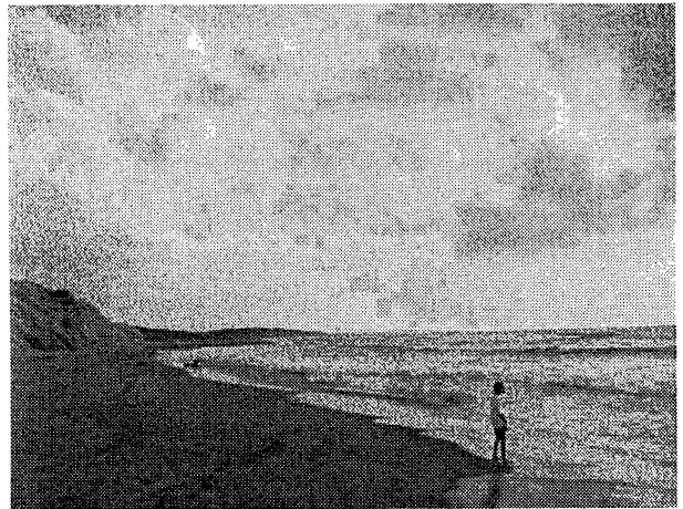
図-1 私たちの沿岸域(石川県加賀市片野海岸)

ーマを絞って、沿岸域はどのように認識されているかについて紹介し、沿岸域に対する関心や沿岸域への関わり、つまり沿岸域への「参加」の問題について話を進めたい。