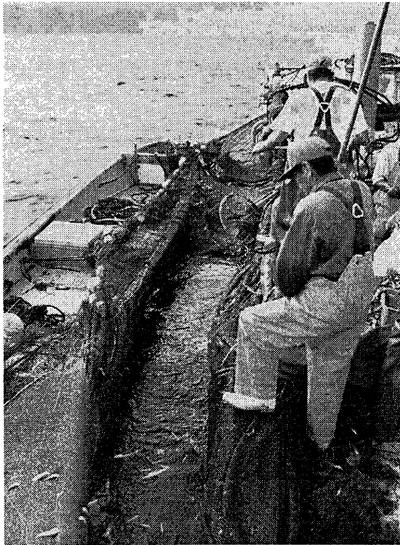
図一4 漁業現場（京都府網野町）

の厳しい操業実態は結びつかない。定置網体験などがある学校では一部の体験もできるが、それとて「参加」ではなく漁業の操業現場の体験どまりである。