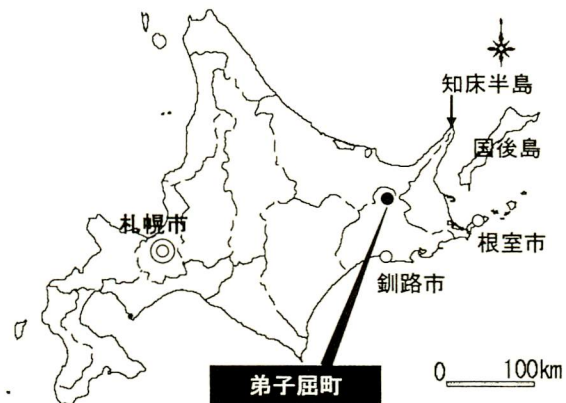
第1図 弟子屈町の位置

弟子屈町の観光は、1886 (明治 19)年に川湯と弟子屈に相次いで温泉旅館が開業したことから始まった。その後、観光業は弟子屈町の主力産業として発展し、屈斜路湖近くに川湯温泉、摩周湖周辺部には摩周温泉が立地し、2001 (平成 13)年までは 120 万人前後の観光入込客数を記録していた 24) 。しかしそれ以降は明らかに減少しており、現在は 100 万人を下回っている。そのため同町の観光関係者には、観光地が衰退しているという意識があった。