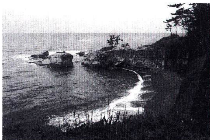
貴重な自然海岸(石川県加賀市)

その仕組みを、視覚的に表すと、前回解説した利用と保全の三角形(三つの視点)①産業的利用と非産業的利用、②特定少数と不特定多数、③地域住民と地域外住民と、環境や資源保護