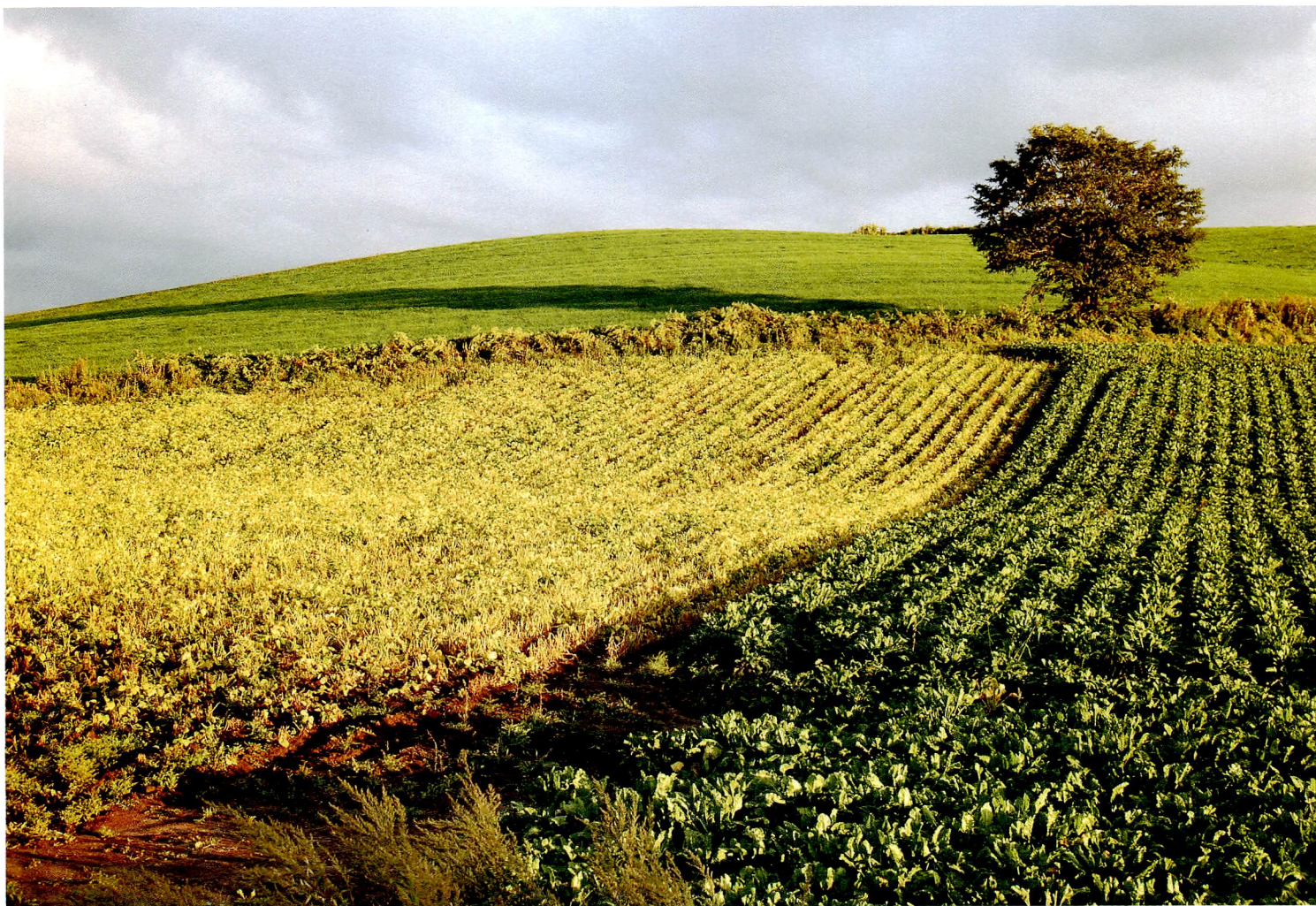
晩夏の落日（北海道美瑛町）