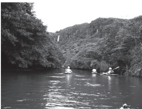
西表島船浦湾のカヤックツアー

このように従来型の観光地の離島でも、またそれ以外の離島でも、エコツーリズムは確実に広がっています。ここで重要なポイントは、エコツーリズムという、海外で生