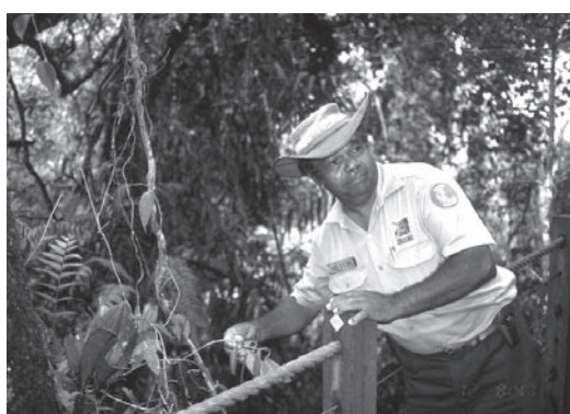
オーストラリア・ケアンズ郊外。ガイドによる熱帯雨林の解説

持続可能な観光の実現のためには、地域資源を再評価し、それを維持するための努力を私たちが忘れてはなりません。離島におけるエコツーリズムの「先進例」はそれを明示しています。