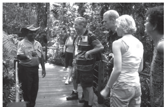
オーストラリア・ケアンズ郊外 クーランダのガイドツアー

こうした保護か利用かという二者択一の隘路に、エコツーリズムは島の自然環境の利用と保全の両立、つまり「持続可能な利用」という新たな道を示しています。そのためには、地域が自律的に地域資源を管理できなければなりません。