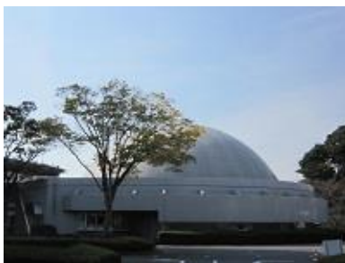
船橋市総合教育センター・プラネタリウム館（千葉県船橋市）