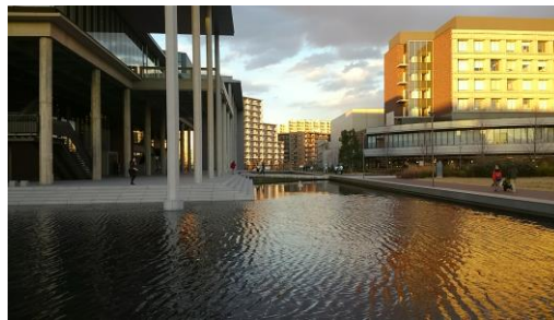
同・葛飾キャンパス（東京都葛飾区）