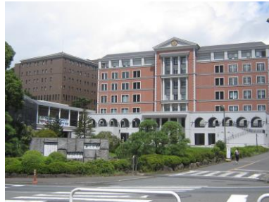
発表者2が勤務する （右）学校法人船橋学園・東葉高等学校 （右）学校法人玉川学園・玉川大学