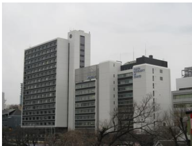
東京理科大学・神楽坂キャンパス（東京都新宿区）