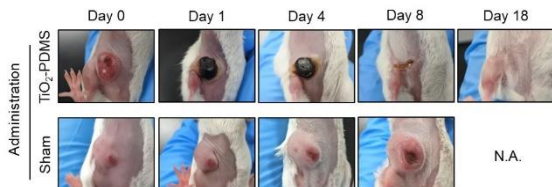
Figure 1: 薬剤耐性トリプルネガティブ乳がん (TNBC) 同所性モデルに対する治療効果

本研究では、様々な足場材料を介して培養した複合細菌AUNの薬剤耐性TNBCを移植した担がんモデルならびに同所性モデルに対する抗がん作用と安全性を検証した。とりわけ光触媒TiO 2 を含有する足場材料がAUNを効果的に弱体化し、その結果として抗がん作用や生体適合性が強化されることを明らかにした。さらに、大動物 (ビーグル犬) におけるAUNの安全性評価によってAUNの高い生体適合性が実証された。本研究は、将来の悪性乳癌の臨床治療に向けて光活性足場材料がAUNの機能増強のための有望な材料の一つに成り得ると期待している。