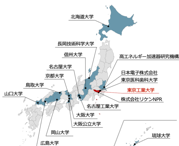
図1 TCカレッジ受講生によるオールジャパン連携ネットワーク構築状況

TC カレッジは，研究力を飛躍的に向上させる「Team 東工大型革新的研究開発基盤イノベーション」を実現する TC を養成するため，社会のニーズに合わせた TC 人財像をもとに既存のプログラムと独自に開発したプログラム，そして連携企業等との共同開発プログラムを体系的にカリキュラム化した産学協働の高度技術人財養成システムである。これらの詳細については，江端（2024） [7] を参考にされたい。TC カレッジは，2021年に東工大オープンファシリティセンターに設置され，2年目となる2022年には，企業を含む学外者の受け入れを開始した。これまでに大学・民間企業を合わせて合計19機関73名が入学し，TM取得者30名，TC取得者6名，2024年9月現在17機関56名が在籍している（図1）。