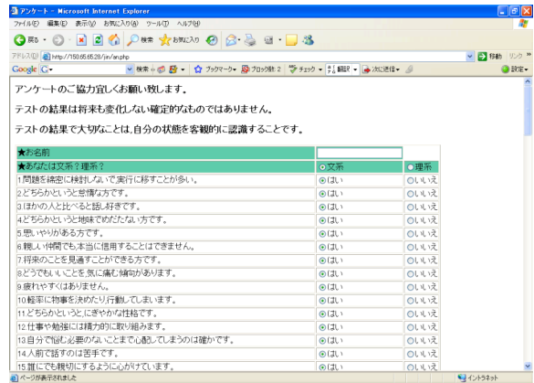
図 1 Web アンケートシステムの画面

いては主要 5 因子性格検査の 70 の質問に対してチェックボックスを用いて「はい」か「いいえ」で選択するようにした。同様に、知識に関しては「文系」か「理系」、文化（国籍）については「中国」か「日本」を選択するようにしている。