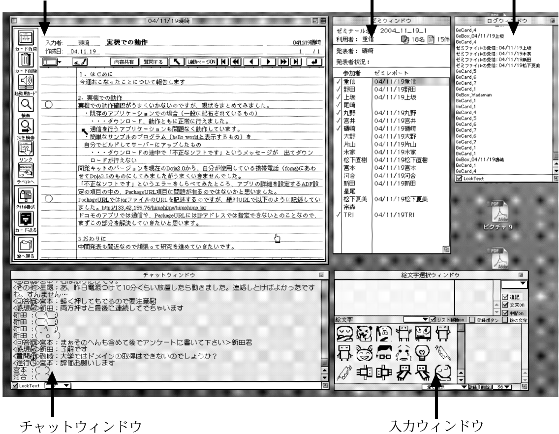
図 1 電子ゼミナールシステムの利用画面 Fig. 1 An example screen of electronic seminar system.

用には、操作権の取得は必要もなく、参加者全員が使いたいときに、いつでも使える。したがって、セマンティック・チャットの使用は、ゼミナールに関係ないインフォーマルなコミュニケーションにも使用可能となっている。