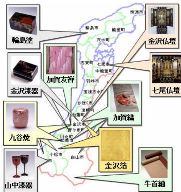
図 1. 石川県の主な伝統的工芸品

石川県の産業全体における伝統的工芸品産業の割合は生産額ベースで 2%に満たない程度であり、経済規模から見ればそれほど大きな比重を占めているわけではない。しかし、輪島塗、加賀友禅、山中漆