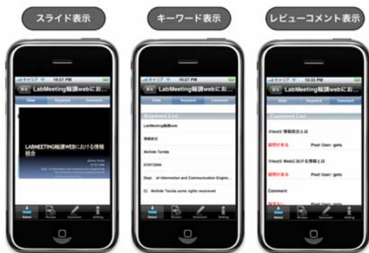
図 3. モバイル端末インタフェース